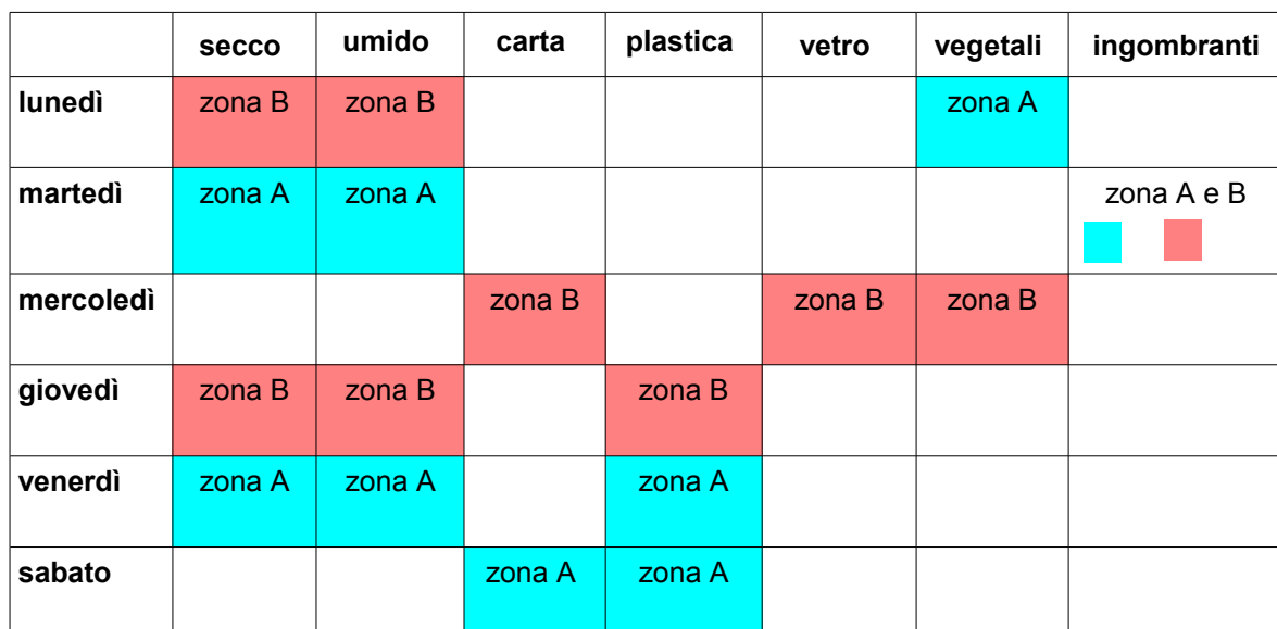
SCHEMA RITIRO RIFIUTI PER ZONE

La suddivisione in zone del territorio comunale è identificata sulla base degli appositi calendari di raccolta (o documenti equivalenti) distribuiti alla popolazione con cadenza annuale. Tali calendari riportano le indicazioni delle festività e dei giorni di sospensione del servizio e relativi recuperi.